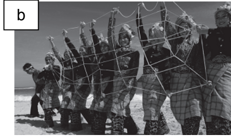
Tari tarek pukat

a. Tuliskan asal daerah, properti tari, dan lagu pengiring tari A dan B.